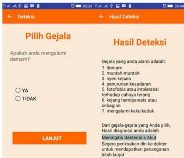
Gambar 4. Halaman Konsultasi

Ketika pengguna meng-klik menu Konsultasi pada halaman utama, maka akan diarahkan ke Halaman konsultasi yang merupakan halaman inti aplikasi. Pada halaman ini akan ditampilkan gejala secara bergantian dan pengguna bisa mengisi Ya/Tidak. Pengguna diwajibkan memilih tiga (3) buah gejala wajib Meningitis untuk diproses oleh sistem. Gejala yang wajib dipilih adalah demam, nyeri kepala, dan muntah-muntah. Apabila pengguna tidak memilih tiga buah gejala wajib itu, maka aplikasi akan menampilkan pesan bahwa pengguna tidak terindikasi penyakit meningitis. Setelah pengguna memilih beberapa gejala yang ingin di-diagnosis, maka selanjutnya pengguna meng-klik tombol LANJUT ditunjukkan pada Gambar 4.