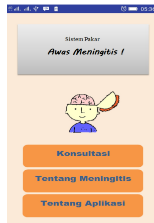
Gambar 2. Halaman awal aplikasi

aplikasi sistem pakar Awasi Meningitis!. Halaman awal aplikasi ditunjukkan pada Gambar 2.